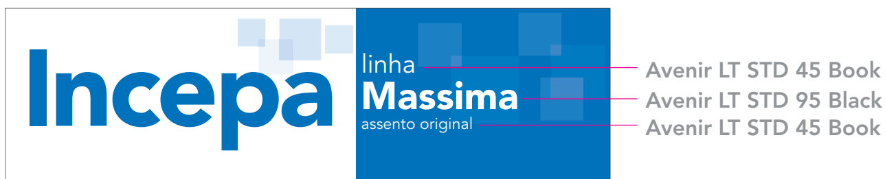
Adesivo de assento Incepa