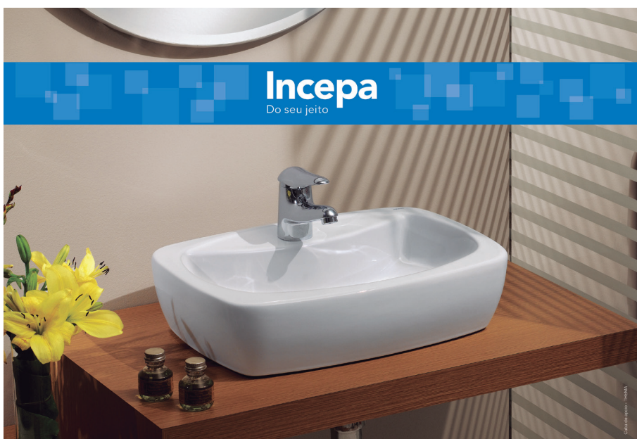
Painel Incepa - Loja Emobrax