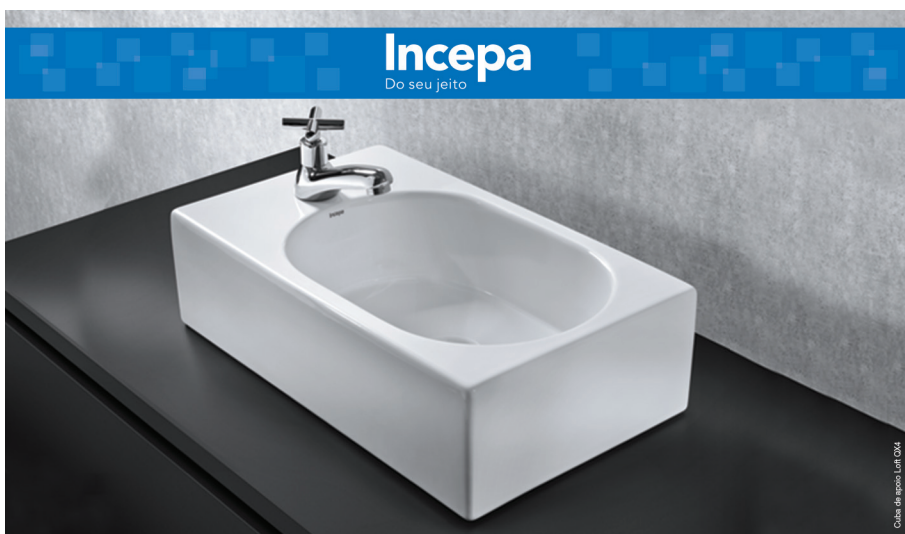
Painel Incepa - Loja Krepischi categoria